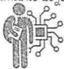
2018 మార్చిలో హార్దవేర్ ఎడిషన్ కోసం గ్రాండ్ ఫినాల్

ఇండియా హాకథాన్ 2018 ఇది డిజిటల్ ప్రాడక్ట్ అభివృద్ధి పోటీ, ఇందులో విస్తృతమైన పరిష్కారాలు కనుగొనడానికి టెక్నాలజీ విద్యార్థులకు మున్యలు ఇవ్వబడతాయి