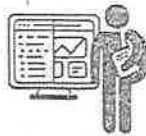
2018 ఫిబ్రవరిలో సాఫ్ట్వేర్ ఎడిషన్ కోసం గ్రాండ్ ఫినాల్